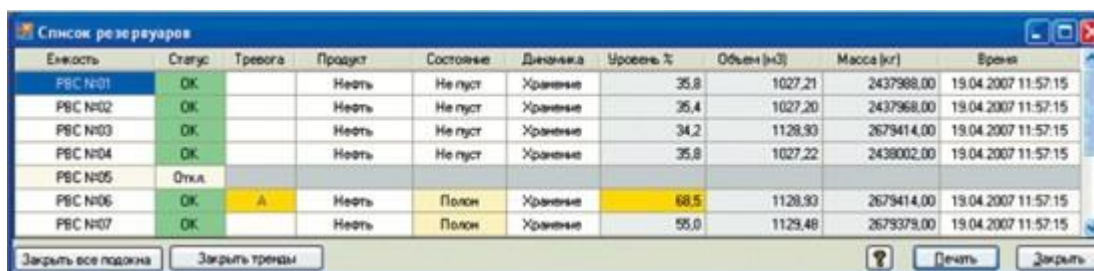
Рисунок 3 – Окно списка резервуаров