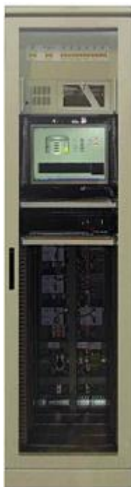
Рисунок 5 – Внешний вид пульта

5.1 Габаритные размеры пульта не превышают 2300x865x600 мм. Масса пульта не превышает 150 кг. Внешний вид пульта представлен на рисунке 5.