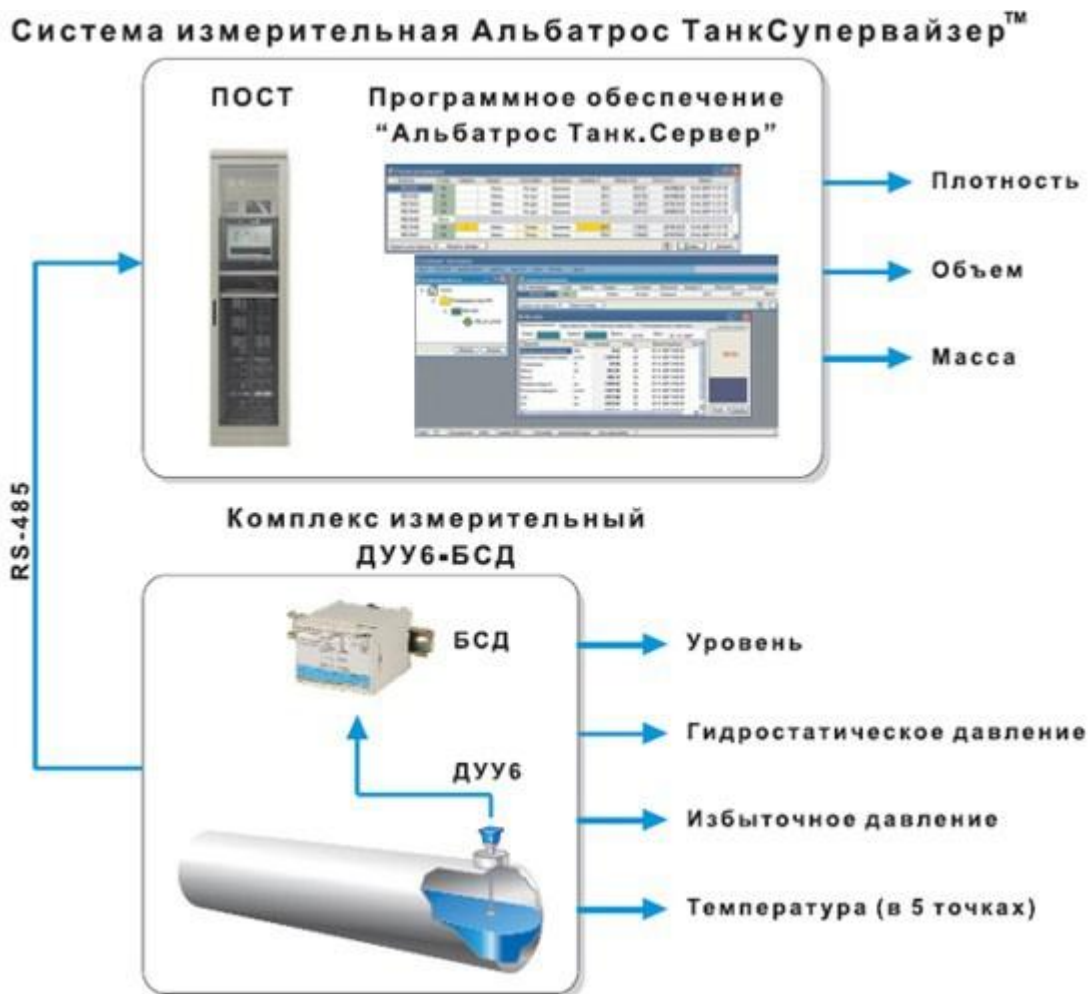
Рисунок 1 – Структура системы

Структура системы представлена на рисунке 1.